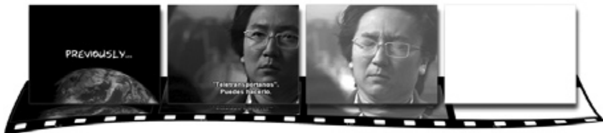
Imagen 1 Fotogramas del previously del episodio de Héroes

Fotogramas del previously del episodio de Héroes : Lo más difícil (#1x21 The Hard part , John Badham, 2007) como ejemplo de previously en cuanto a su explícito reconocimiento visual y su conexión del cliffhanger del último episodio con el incipit del presente mediante fundido a blanco, mecanismo, éste último, utilizado de forma similar en Mujeres desesperadas ( Desperate housewives )